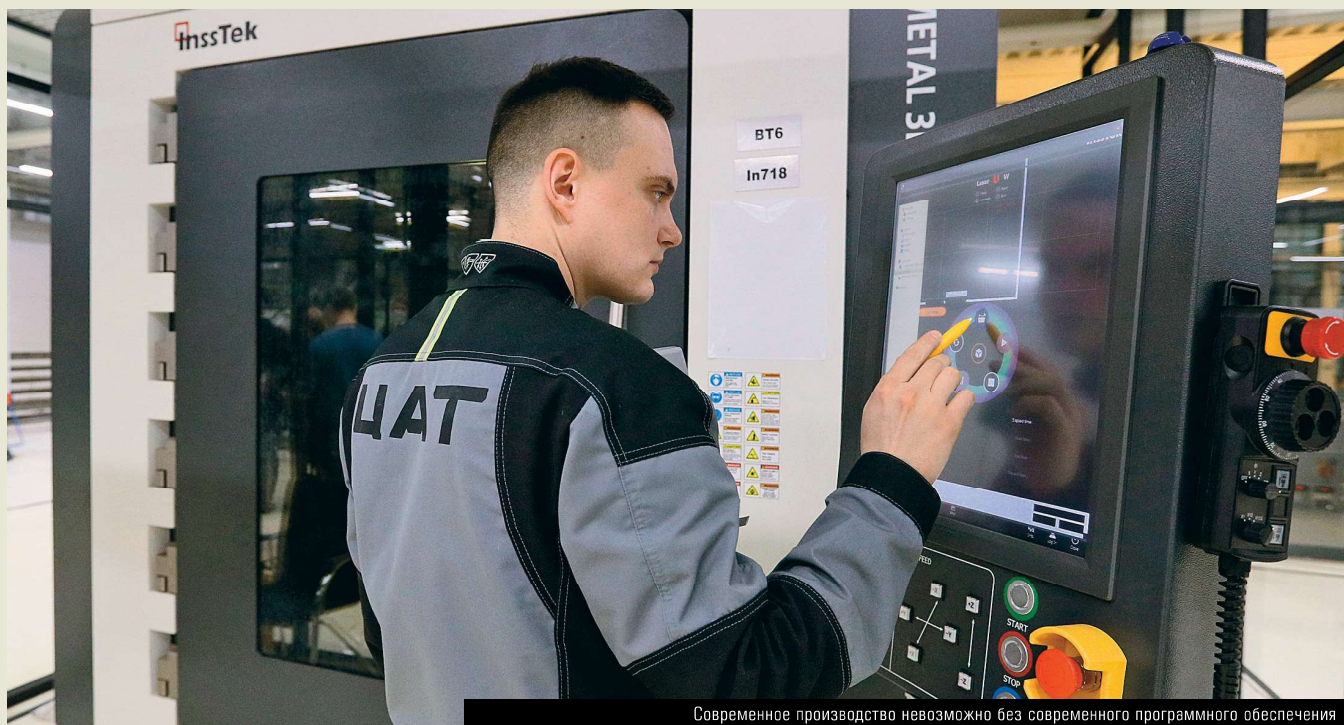
Современное производство невозможно без современного программного обеспечения

Российские производители инженерного программного обеспечения медленно теснят своих иностранных конкурентов на домашнем рынке. Ускорить процесс помогут меры государственной поддержки как самих софтверных компаний, так и потребителей их продукции